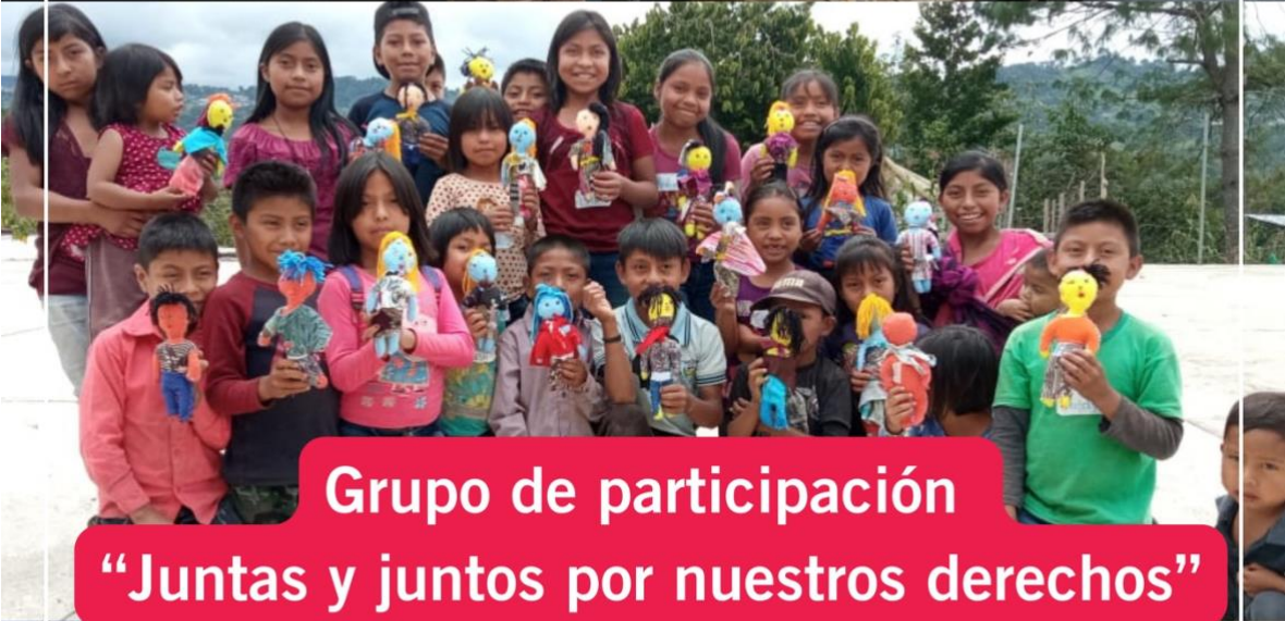
Grupo de participación "Juntas y juntos por nuestros derechos"