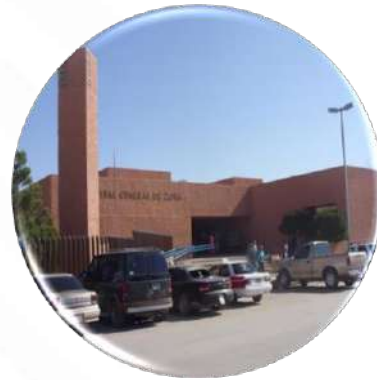
Hospital General de Subzona No. 12