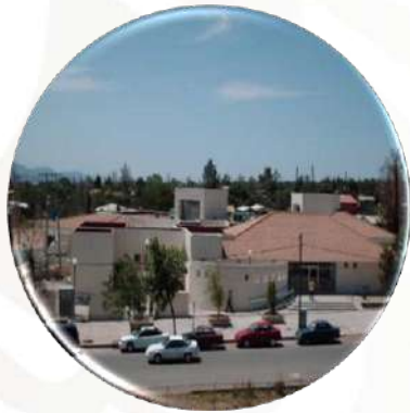
Unidad Familiar No. 55 IMSS